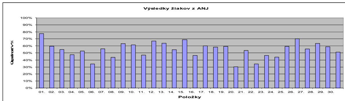
Graf 2 Dosiahnuté výsledky v ANJ

Najlepšie výsledky dosiahli žiaci pri riešení úloh: