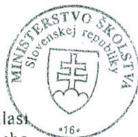
Martin Fronc minister

Táto kópia listiny /odpis/ doslovne súhlasí s predloženým originálom listiny, alebo osvedčenou kópiou /odpisom/ listiny. Počet osvedčovaných listov /strán...../.....zapísaných v osvedčovacej knihe Mestskej časti Bratislava-Karlova Ves pod číslom..... dňa 29. 5. 2009