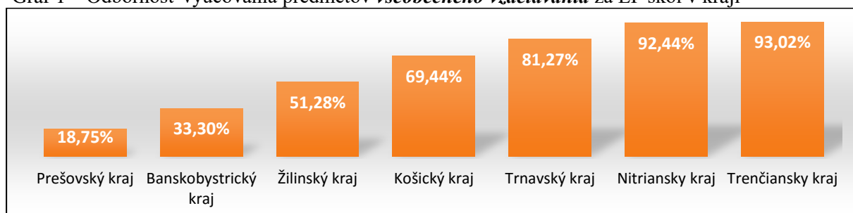
Graf 1 – Odbornosť vyučovania predmetov všeobecného vzdelávania za EP škôl v kraji

Slabou stránkou bola aj nízka odbornosť vyučovania teoretických odborných predmetov (67 %) a predmetov praktickej prípravy (73 %).